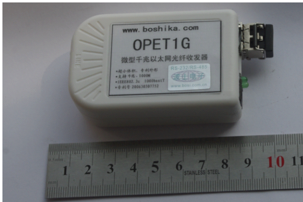
图6 产品实物立体图